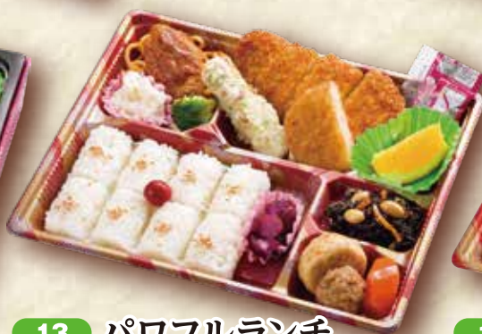
13 パワフルランチ 26.7×20.6cm