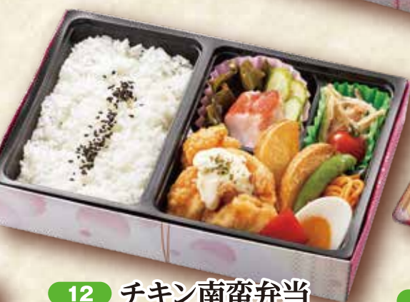
12 チキン南蛮弁当 24×16.5cm