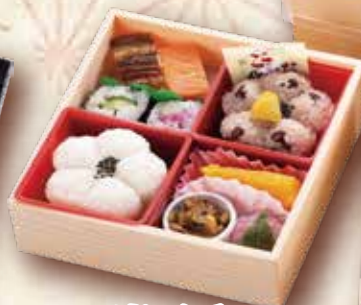
2 慶び重ね 喜食満面 (5.5寸) きしょくまんめん 16.5×16.5cm×2段