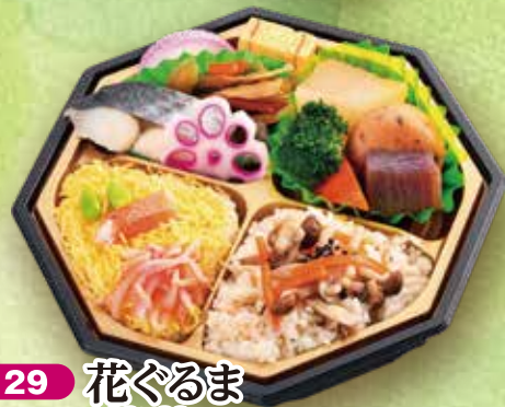
29 花ぐるま 20×20cm