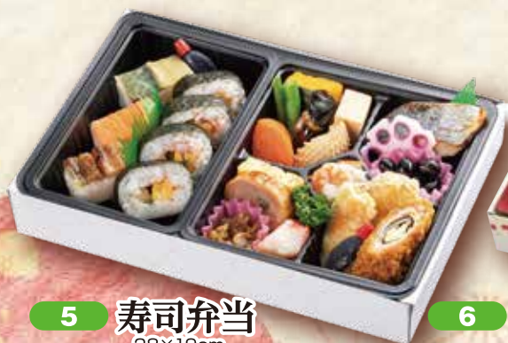
5 寿司弁当 28×19cm