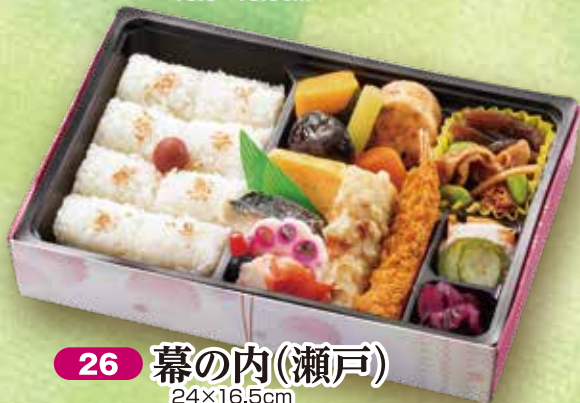
26 幕の内(瀬戸) 24×16.5cm