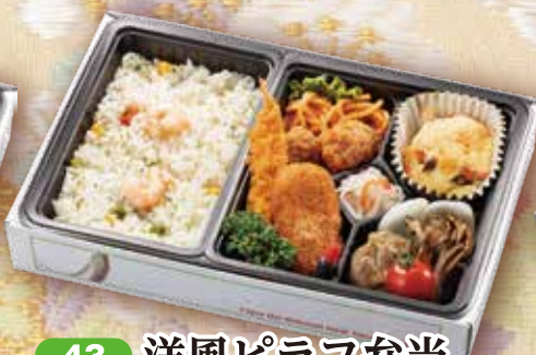
43 洋風ピラフ弁当 27.5×18cm