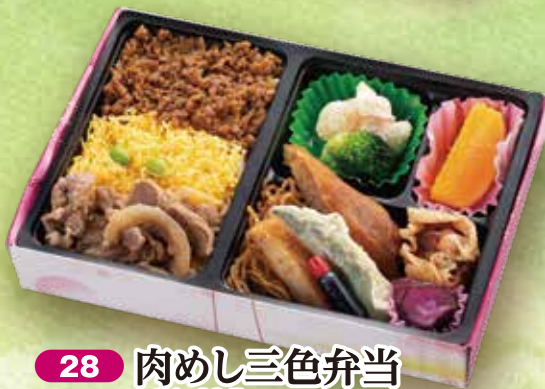
28 肉めし三色弁当 24×16.5cm