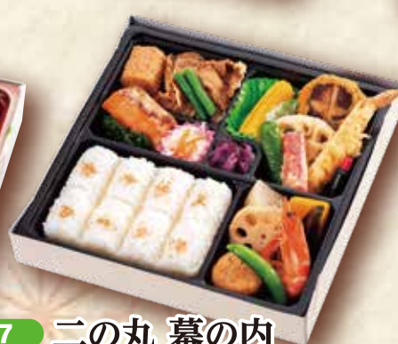
7 二の丸 幕の内 24.5×24.5cm