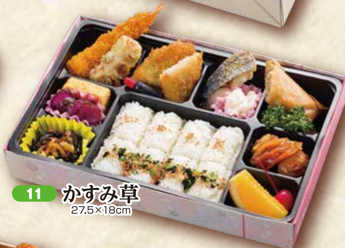
11 かすみ草 27.5×18cm