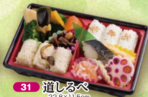
31 道しるべ 22.8×11.5cm