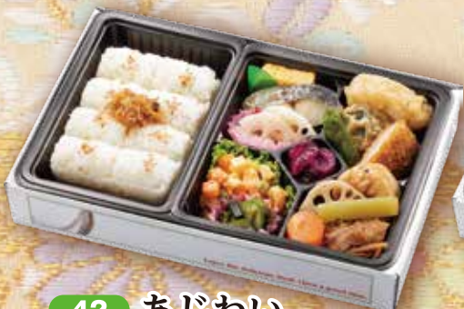
42 あじわい 27.5×18cm