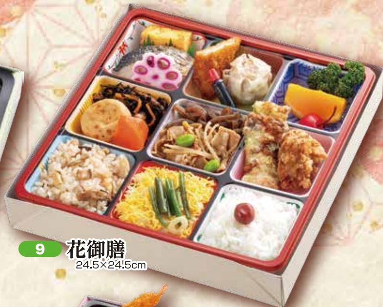
9 花御膳 24.5×24.5cm