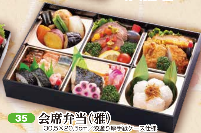
35 会席弁当(雅) 30.5×20.5cm / 漆塗り厚手紙ケース仕様