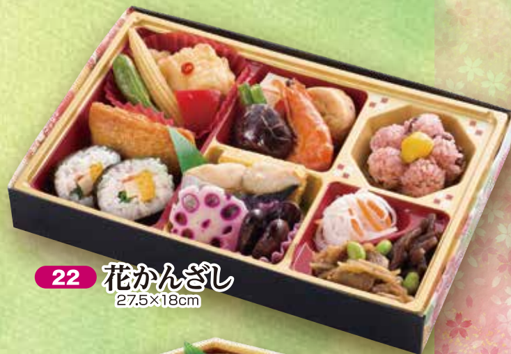
22 花かんざし 27.5×18cm