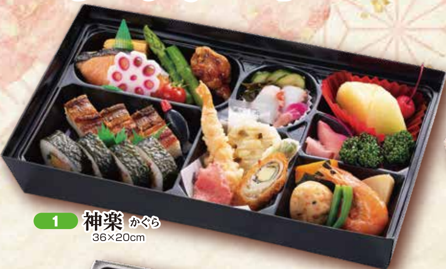
1 神楽 かぐら 36×20cm