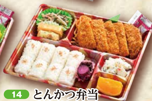
14 とんかつ弁当 26.7×20.6cm