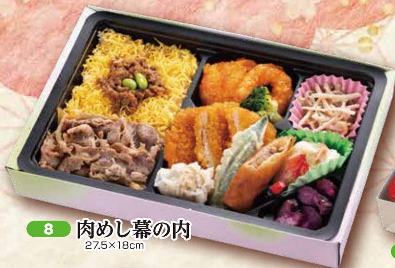
8 肉めし幕の内 27.5×18cm