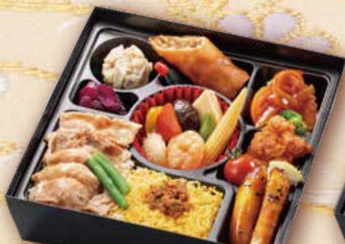
36 中華餡かけ御膳 21.5×21.5cm