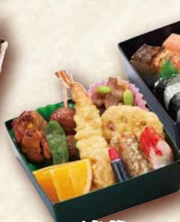
4 三色櫓 さんしょくやぐら 13×13cm×3段