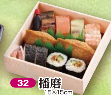
32 播磨 15×15cm