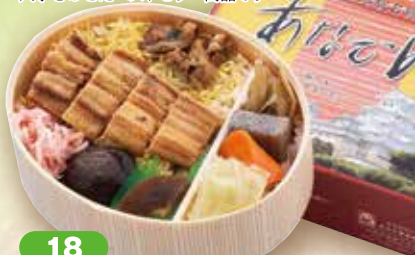
18 あなごめし 17.5×14cm

当社自慢のだしで炊いたご飯の上にタレで煮込んだ 穴子をのせたベストセラー商品です