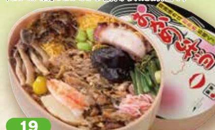
19 おかめ弁当 19×15cm

色々なおかずをトッピングしているところから 「おかめ八目」のおかめから名付けられたお弁当です