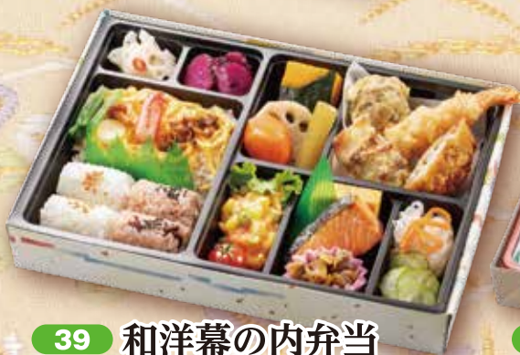
39 和洋幕の内弁当 29×20cm