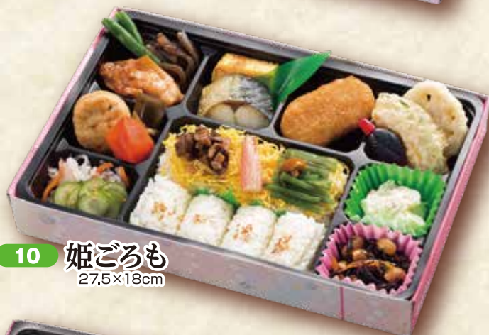
10 姫ごろも 27.5×18cm