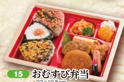
15 おむすび弁当 23×19.5cm