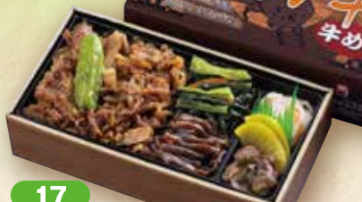
17 但馬牛 牛めし弁当 20.5×11cm

当社自慢のだしで炊いたご飯の上にタレで煮込んだ 穴子をのせたベストセラー商品です