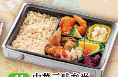
44 中華三昧弁当 27.5×18cm