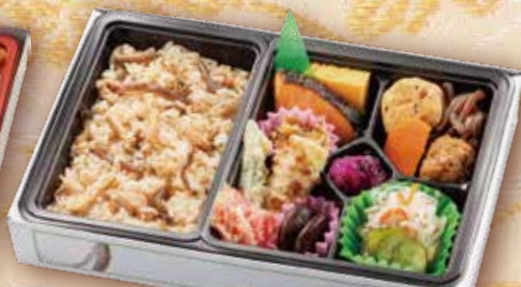
41 かやくご飯と銀鮭の 幕の内弁当 27.5×18cm