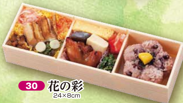
30 花の彩 24×8cm