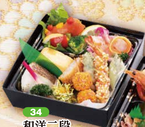
34 和洋二段 幕の内 風月 [上段] 22.6×22.6cm [下段] 21.1×21.1cm [二重高さ] 9.3cm