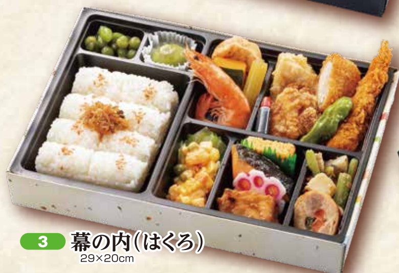
3 幕の内(はくろ) 29×20cm