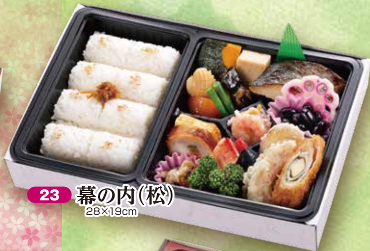
23 幕の内(松) 28×19cm