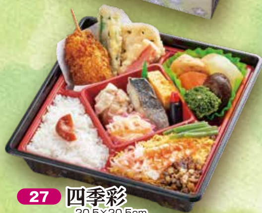
27 四季彩 20.5×20.5cm