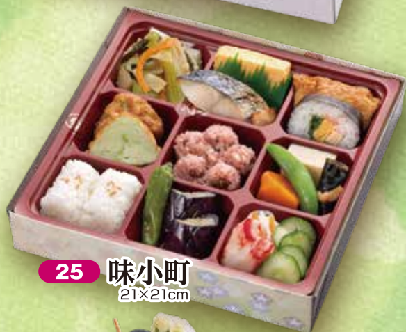
25 味小町 21×21cm