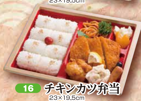
16 チキンカツ弁当 23×19.5cm