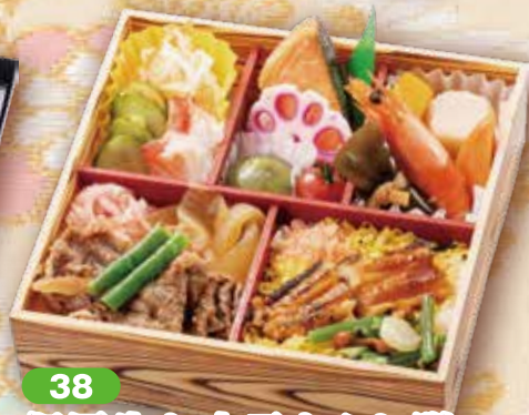
38 但馬牛と穴子ちらし膳 18×18cm