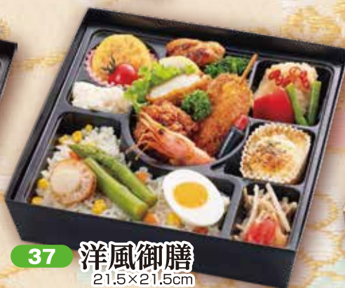
37 洋風御膳 21.5×21.5cm