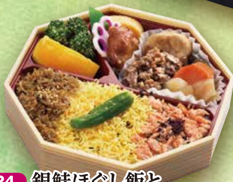
24 銀鮭ほぐし飯と 但馬牛の味くらべ 18.5×18.5cm