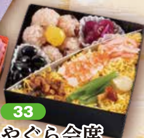
33 やぐら会席 13×13cm×3段