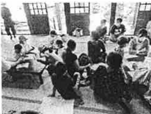
子ども食堂等への助成金支援