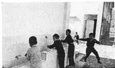
ネパールの学校整備支援 （写真は水道設備支援）

なお、寄せられた募金によるこれまでの支援につきましては、「子どもたちの笑顔のために募金」管理委員会における協議を経て、海外支援（国際的に活動する団体への助成、カトマンズ本願寺と連携したネパールの子どもたちへの支援、ユニセフを通じたウクライナ及びガザの子どもたちへの支援）に【約4,500万円】、子どもたちの居場所づくり支援（子ども食堂・学習支援等に取り組む寺院・団体への助成）に【約2,220万円】、浄土真宗本願寺派全国児童養護施設連絡協議会加盟施設及び母子生活支援施設本願寺ウィスタリアガーデンといった施設に暮らす子どもたちへの支援【約3,400万円】を行っております。詳細な内容につきましては、『宗報』『本願寺新報』『宗派公式WEBサイト（HP）』等において随時掲載しておりますので、ご参照ください。