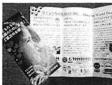
(2)リーフレット（A4 三つ折り）